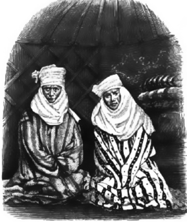
Resim 1. Kazak Kadınları 49

şey yapmayan tembel kişiler olduklarından işlerin çoğu kadınlara kalır". 47 Radloff ise Schuyler'in tam tersine "Erkek ile kadın arasındaki iş taksimi çok mütenasiptir" 48 demektedir. Fikrimizce de bozkırdaki yaşam şartları göz önünde bulundurulduğunda Radloff'un tespitleri daha doğrudur. Çadırın içiyle ilgili işleri kadının, dışarıdaki işleri ise erkeğin yapması şeklinde bir paylaşımın olması muhtemeldir.